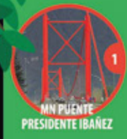
1 MN PUENTE PRESIDENTE IBAÑEZ