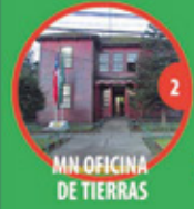
2 MN OFICINA DE TIERRAS