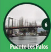
6 Puente Los Palos