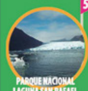
5 PARQUE NACIONAL LAGUNA SAN RAFAEL