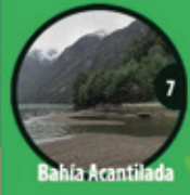
7 Bahía Acantilada

Ilustre Municipalidad de Aysén construyendo comuna junto a ti